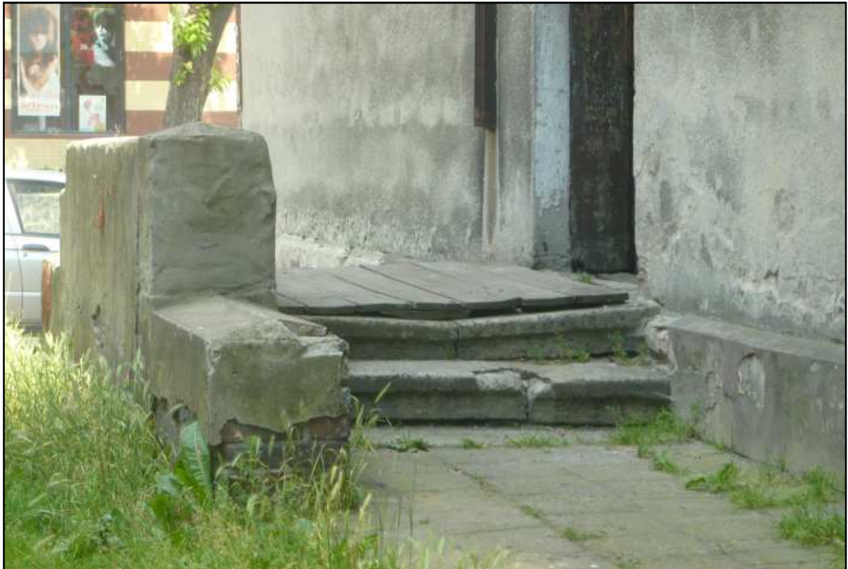
Fot. 14 Budynek przy ul. Opolskiej 40. Uszkodzenia schodów zewnętrznych.