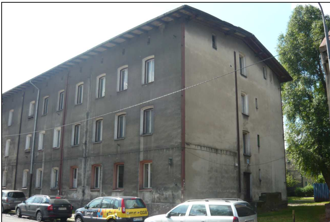
Fot. 1 Budynek przy ul. Opolskiej 40. Elewacja północno-wschodnia i północno-zachodnia.