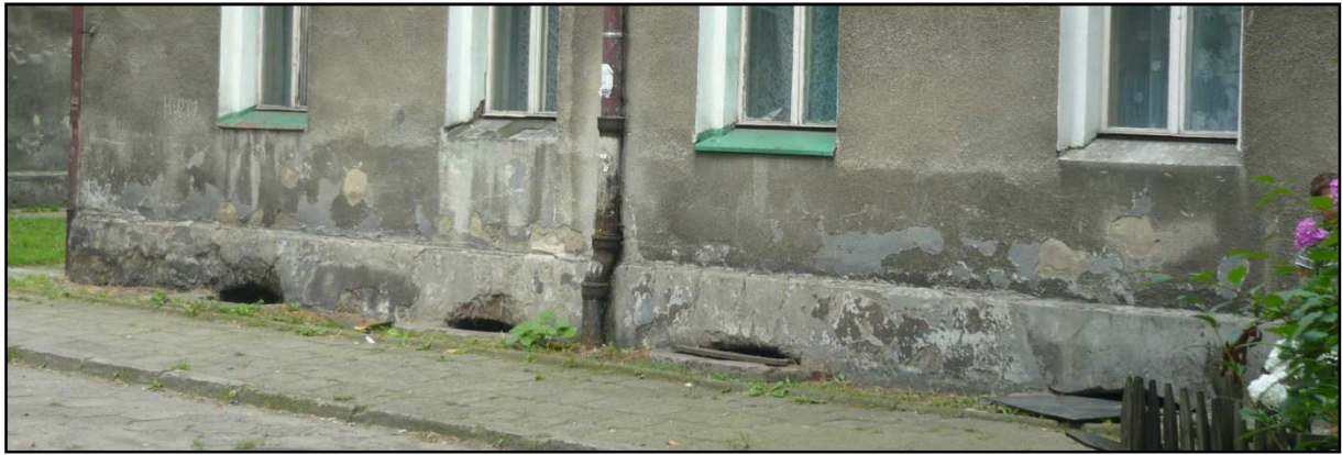
Fot. 10 Budynek przy ul. Opolskiej 40. Zniszczenia strefy cokołu, zawilgocenie ścian przyziemia.