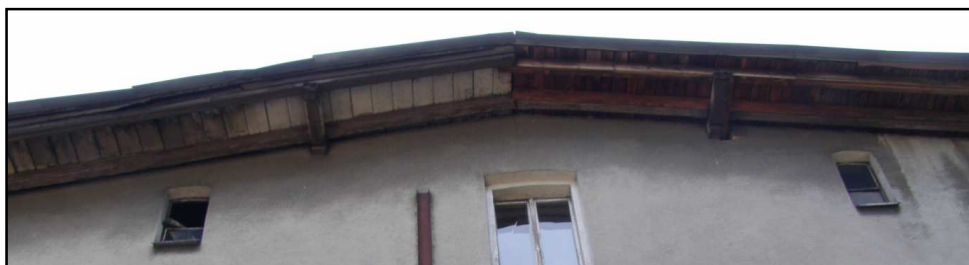
Fot. 7 Budynek przy ul. Opolskiej 40. Korozja biologiczna więźby dachowej.