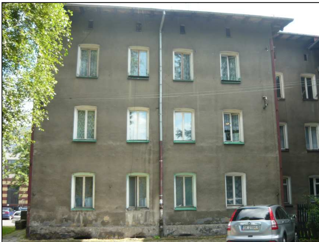
Fot. 3 Budynek przy ul. Opolskiej 40. Elewacja południowo-zachodnia.