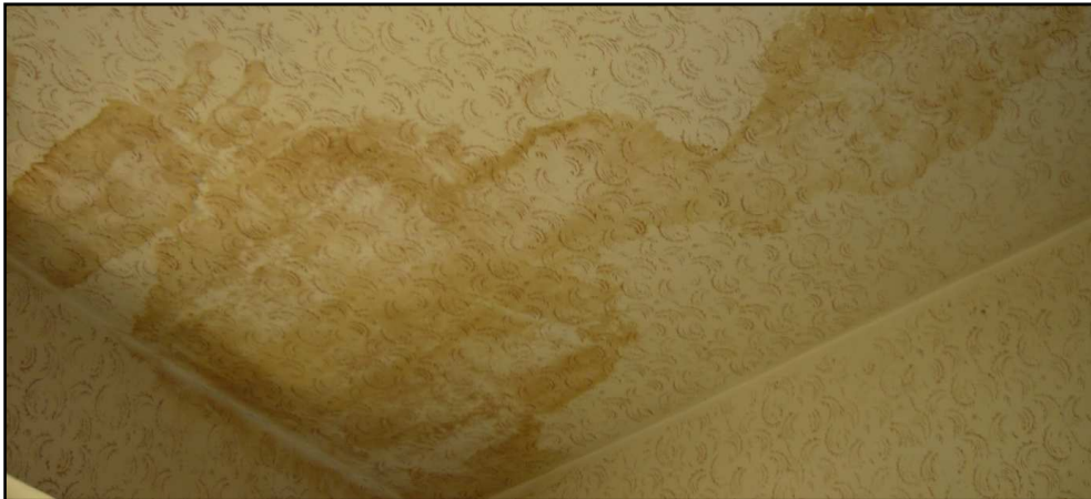
Fot. 18 Budynek przy ul. Opolskiej 40. Widok sufitu na poddaszu.