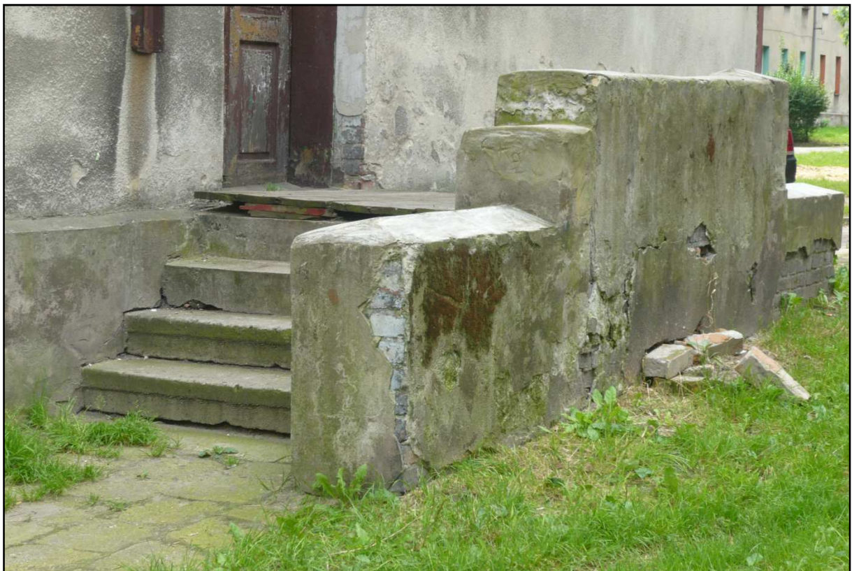
Fot. 15 Budynek przy ul. Opolskiej 40. Uszkodzenia schodów zewnętrznych.