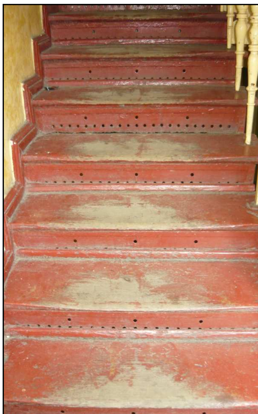
Fot. 20, Fot. 21 Budynek przy ul. Opolskiej 40. Widok klatki schodowej, techniczne zużycie stopni.