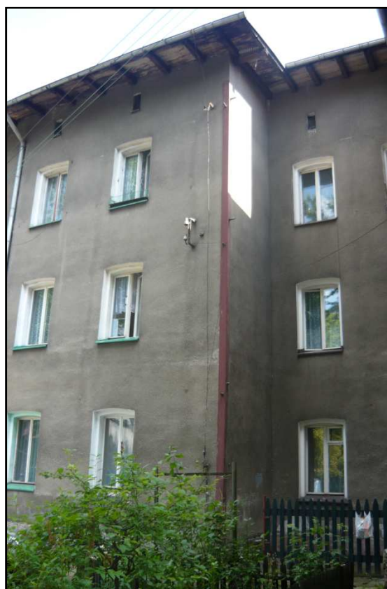
Fot. 4 Budynek przy ul. Opolskiej 40. Elewacja południowo-zachodnia i południowo-wschodnia.