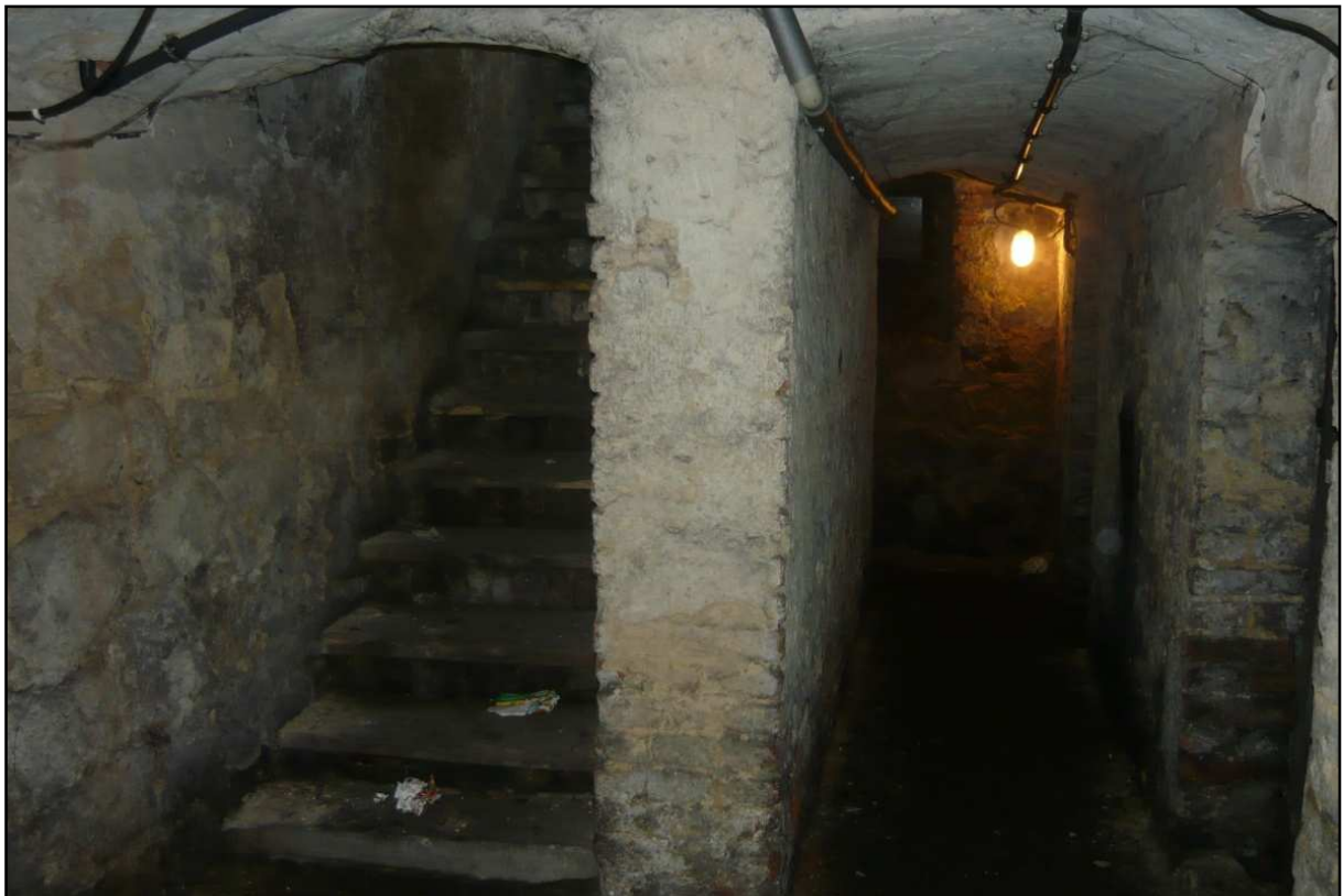
Fot. 17 Budynek przy ul. Opolskiej 40. Widok piwnicy, spękania tynków, zawilgocenie ścian.