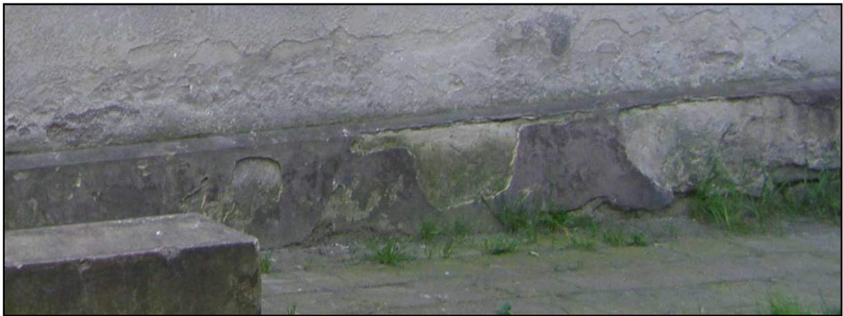
Fot. 11 Budynek przy ul. Opolskiej 40. Zniszczenia strefy cokołu, zawilgocenie ścian przyziemia.