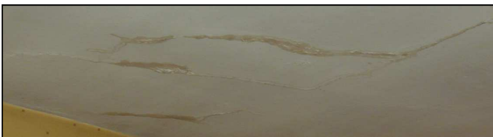
Fot. 19 Budynek przy ul. Opolskiej 40. Widok sufitu w mieszkaniu.