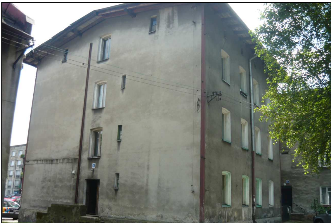
Fot. 2 Budynek przy ul. Opolskiej 40. Elewacja północno-zachodnia i południowo-zachodnia.