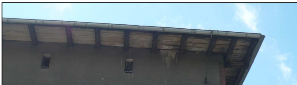
Fot. 6 Budynek przy ul. Opolskiej 40. Korozja biologiczna więźby dachowej.