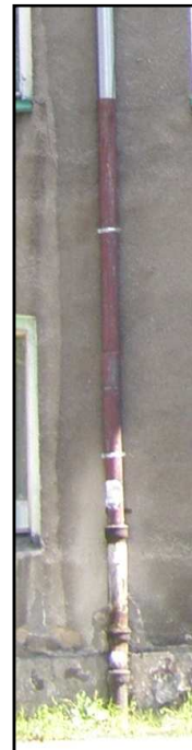
Fot. 12, Fot. 13 Budynek przy ul. Opolskiej 40. Zniszczenia tynku spowodowane zaciekiem wód deszczowych po elewacji, korozja rury spustowej.