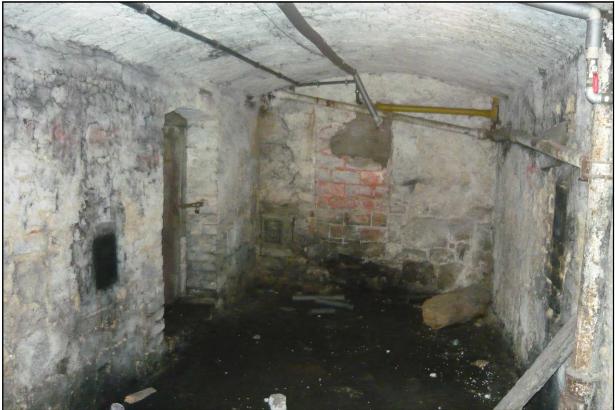
Fot. 16 Budynek przy ul. Opolskiej 40. Widok piwnicy, spękania tynków, zawilgocenie ścian.